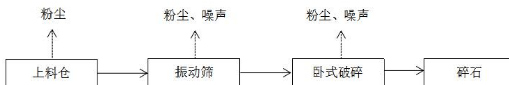
图 2-2 工艺流程和产污环节示意图