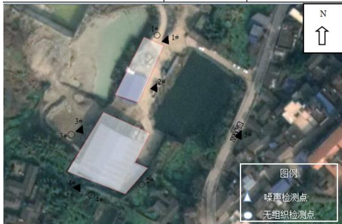
图 6-1 布点示意图