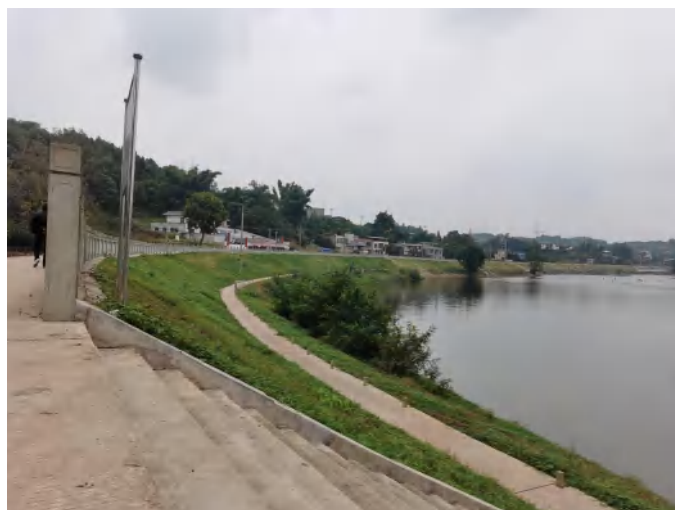
濂溪河牛滩镇上游堤坝现状