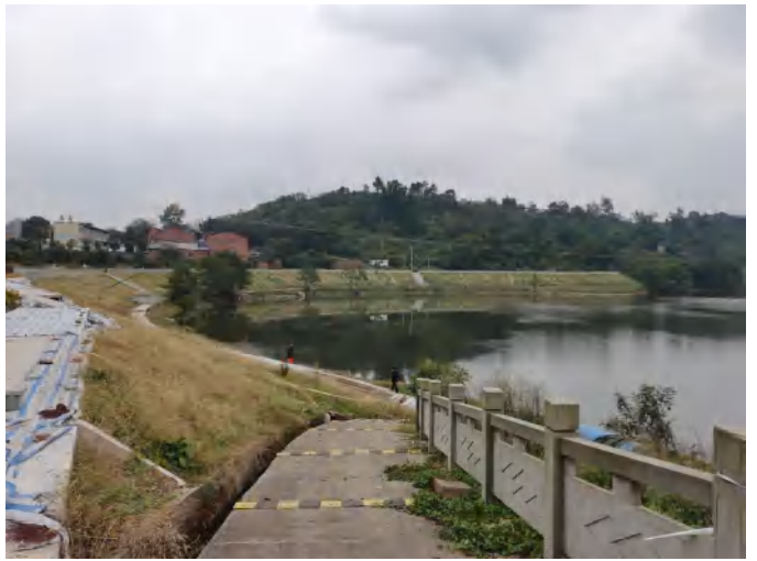
濑溪河牛滩镇下游堤坝现状