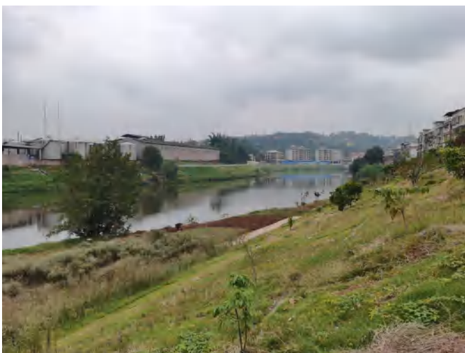
濑溪河牛滩镇沿岸堤坝现状