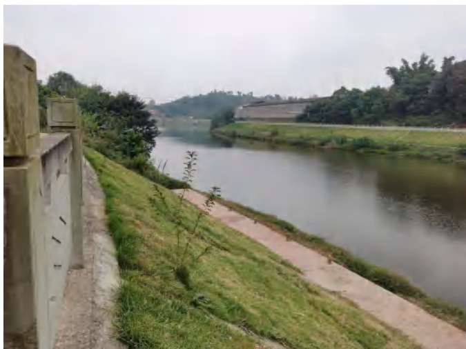
濂溪河牛滩镇左岸堤坝现状