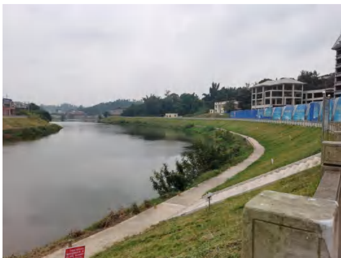
濂溪河牛滩镇右岸堤坝现状