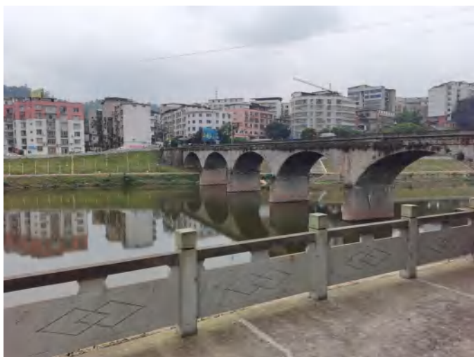
牛滩大桥堤坝现状