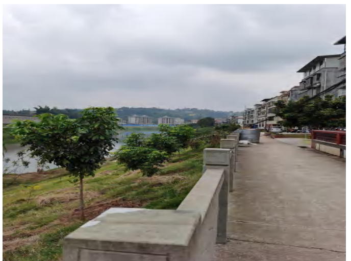
濑溪河牛滩镇沿岸堤坝现状