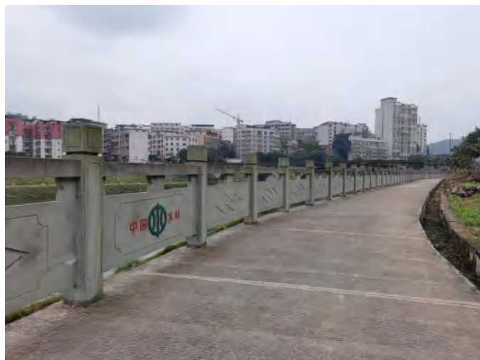
濂溪河牛滩镇沿河堤坝护栏