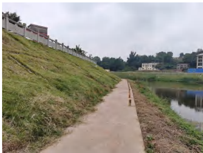
濂溪河牛滩镇左岸堤坝现状