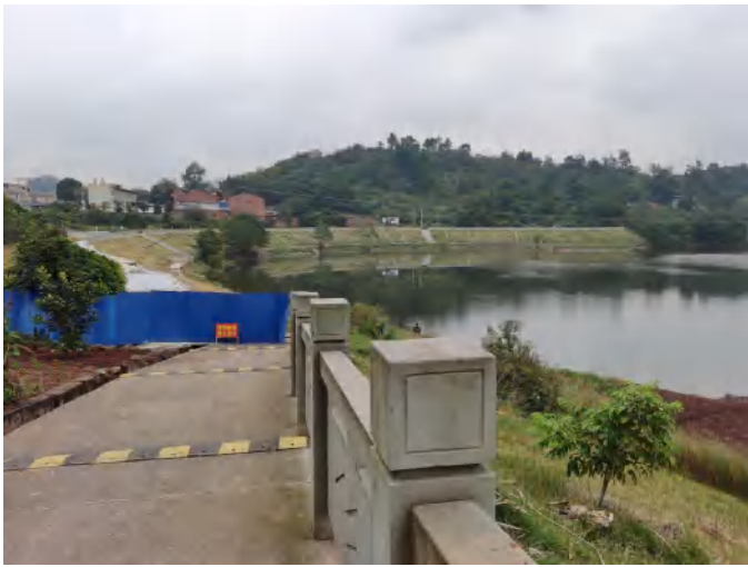
濑溪河牛滩镇下游堤坝现状